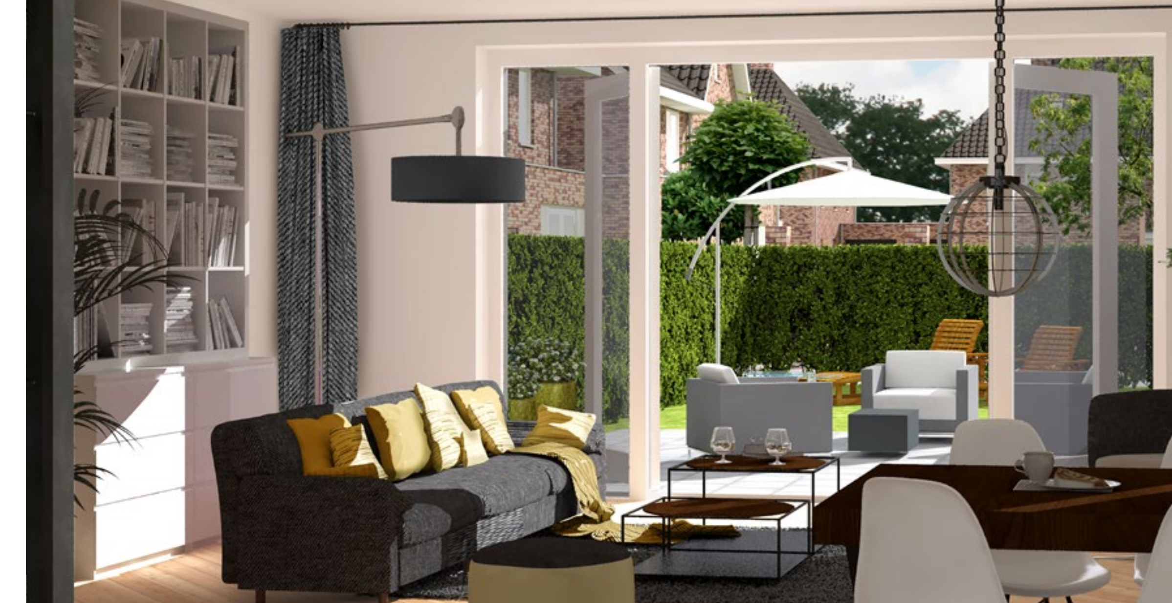
WOONOPPERVLAK CA. 122 M 2 GO