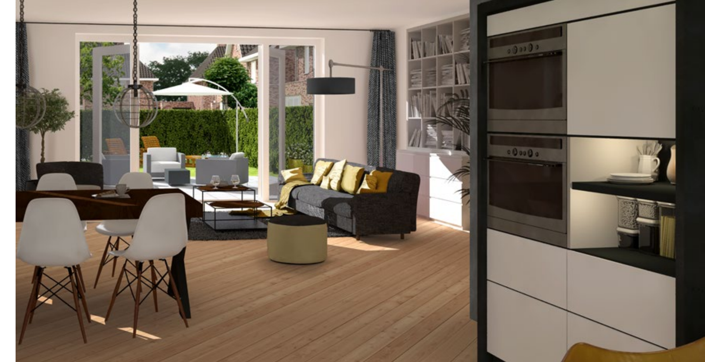
WOONOPP. BNR. 125 CA. 161 M 2 GO EN BNR. 139 CA. 154 M 2 GO