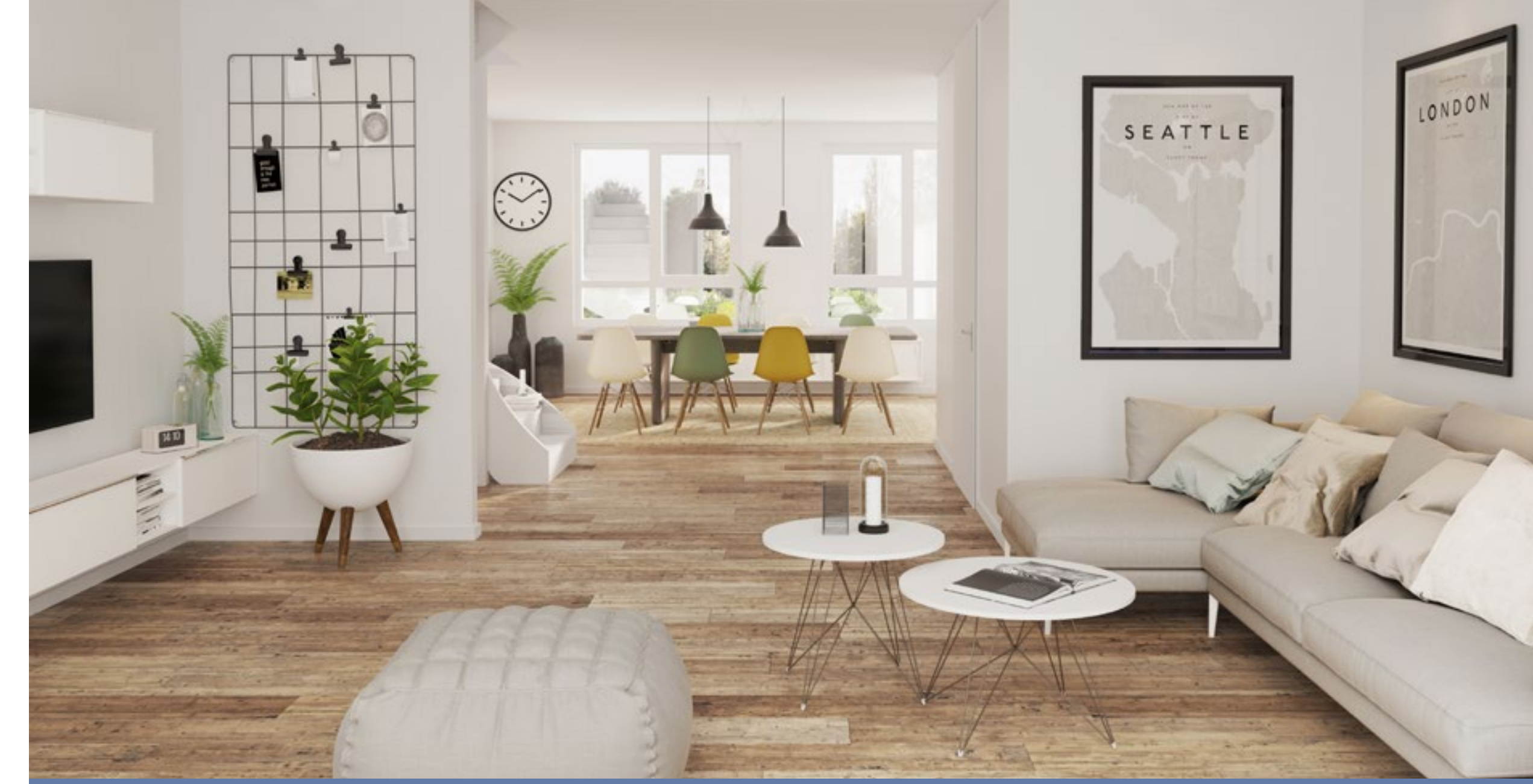
WOONOPPERVLAK CA. 162 M 2